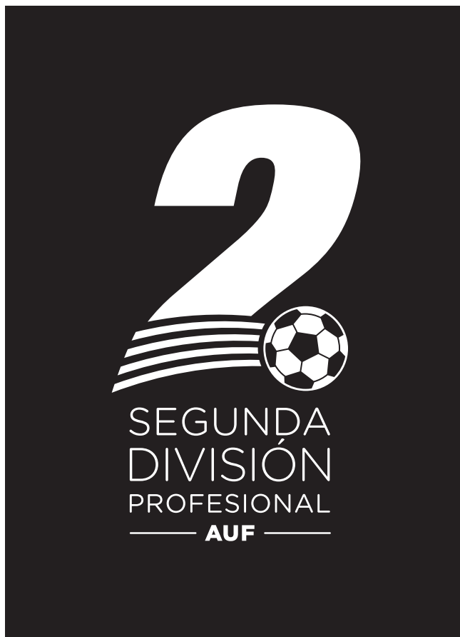
Versión 1 tinta blanco sobre fondo negro / oscuro