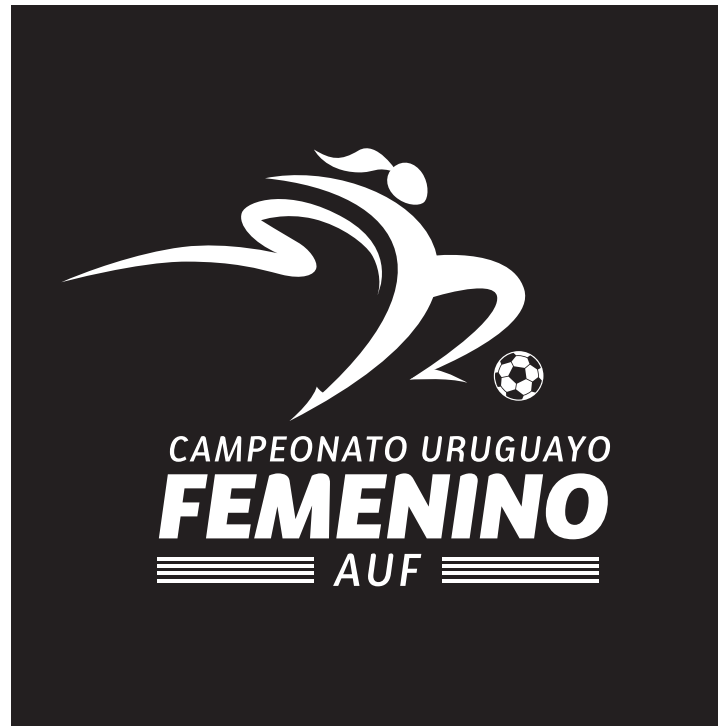
Versión 1 tinta blanco sobre fondo negro / oscuro