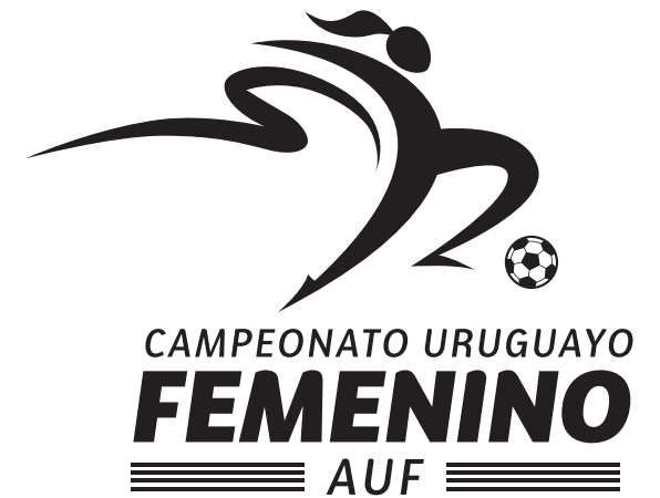
Versión 1 tinta negro sobre fondo blanco / claro