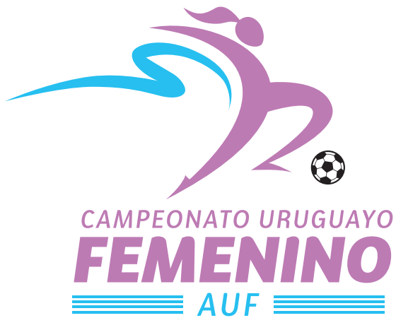
Versión color sobre fondo blanco / claro