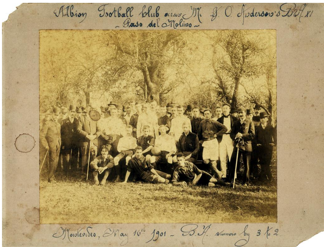
Foto original del partido disputado el 16/5/1901 entre el Albion FC y el Mr. J. O. Anderson's Bs. As. XI.